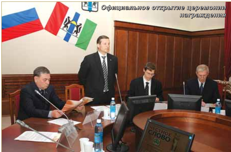
Официальное открытие церемонии награждения

образования, строительства, науки и др. Традиционно по количеству лауреатов конкурса лидирует строительная отрасль. В этом году в разных номинациях, связанных со строительством, победу одержали шесть предприятий и директоров. Кроме того, лауреатами стали трое представителей системы высшего, профессионального, общего и дополнительного образования. В сфере сельского хозяйства определилось пять победителей, в транспортной отрасли — трое, в торговле — четверо. Среди лауреатов промышленного комплекса Западной Сибири наградами «Директор года» и «Предприятие года» отмечены такие крупные предприятия, как ЗАО «Томский завод электроприводов», ФГУП «Новосибирский механический завод «Искра».