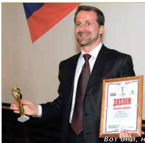
Вот они, наши лауреаты

Двенадцать месяцев право именоваться «Директором года» и «Предприятием года» отстаивали «первые лица» сибирских предприятий и организаций различных отраслей промышленности, торговли, сельского хозяйства, здравоохранения,